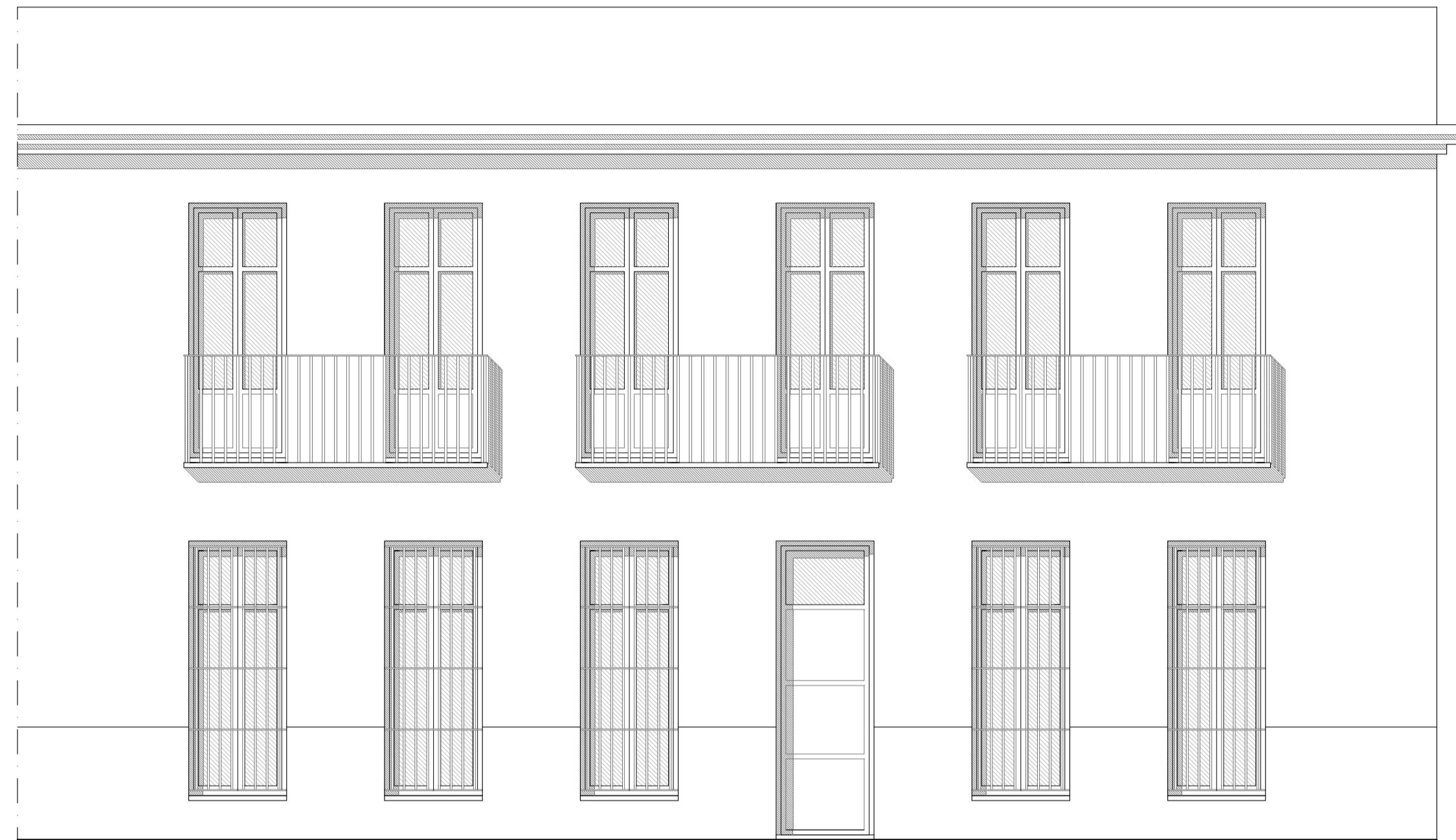
FACHADA Pça. DOCTOR LLORENÇ DE LA FLOR