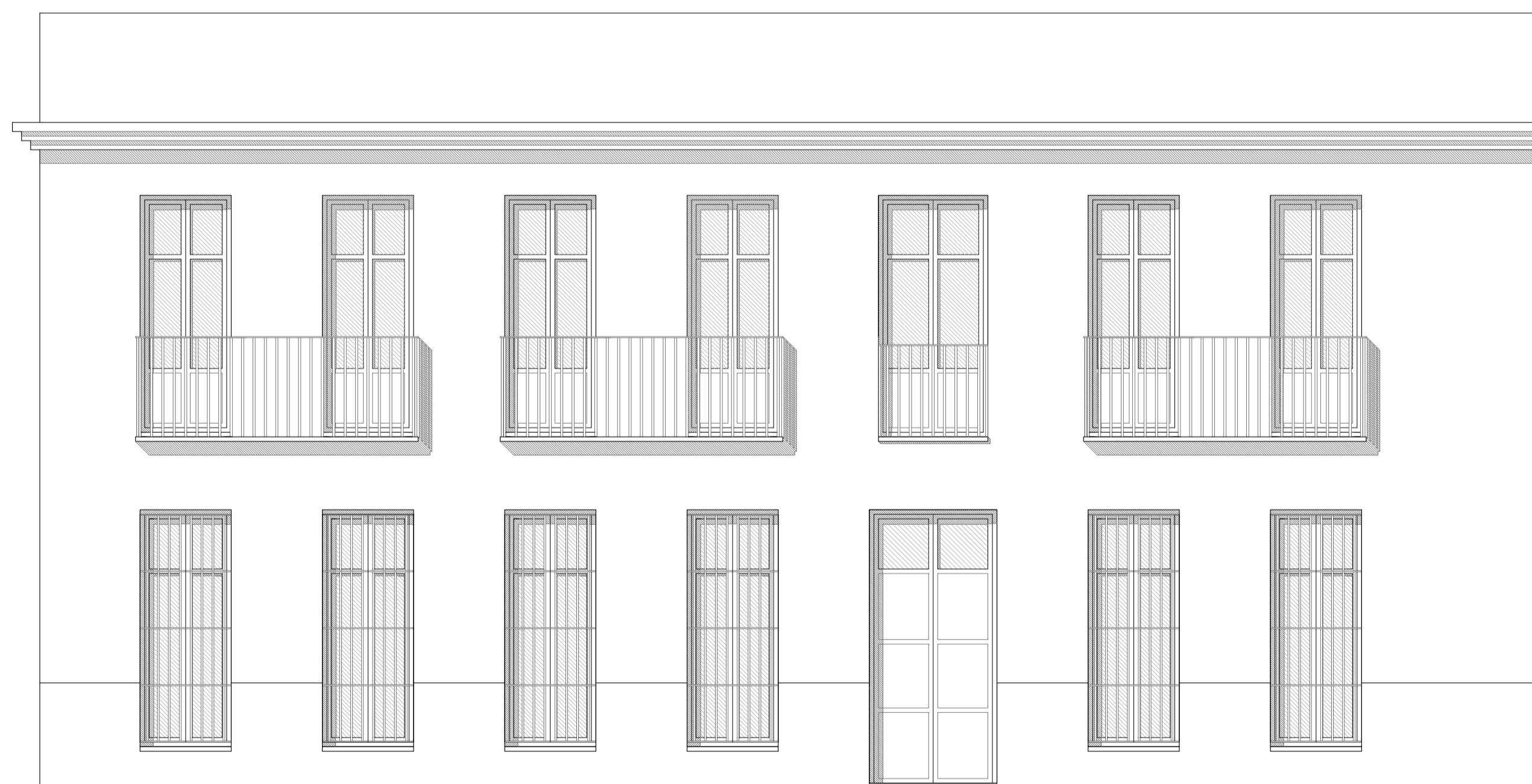
FACHADA CARRER D'ESCALANTE

PROMUEVE: AYUNTAMIENTO DE VALENCIA. SERVICIO DE BIENESTAR SOCIAL E INTEGRACIÓN