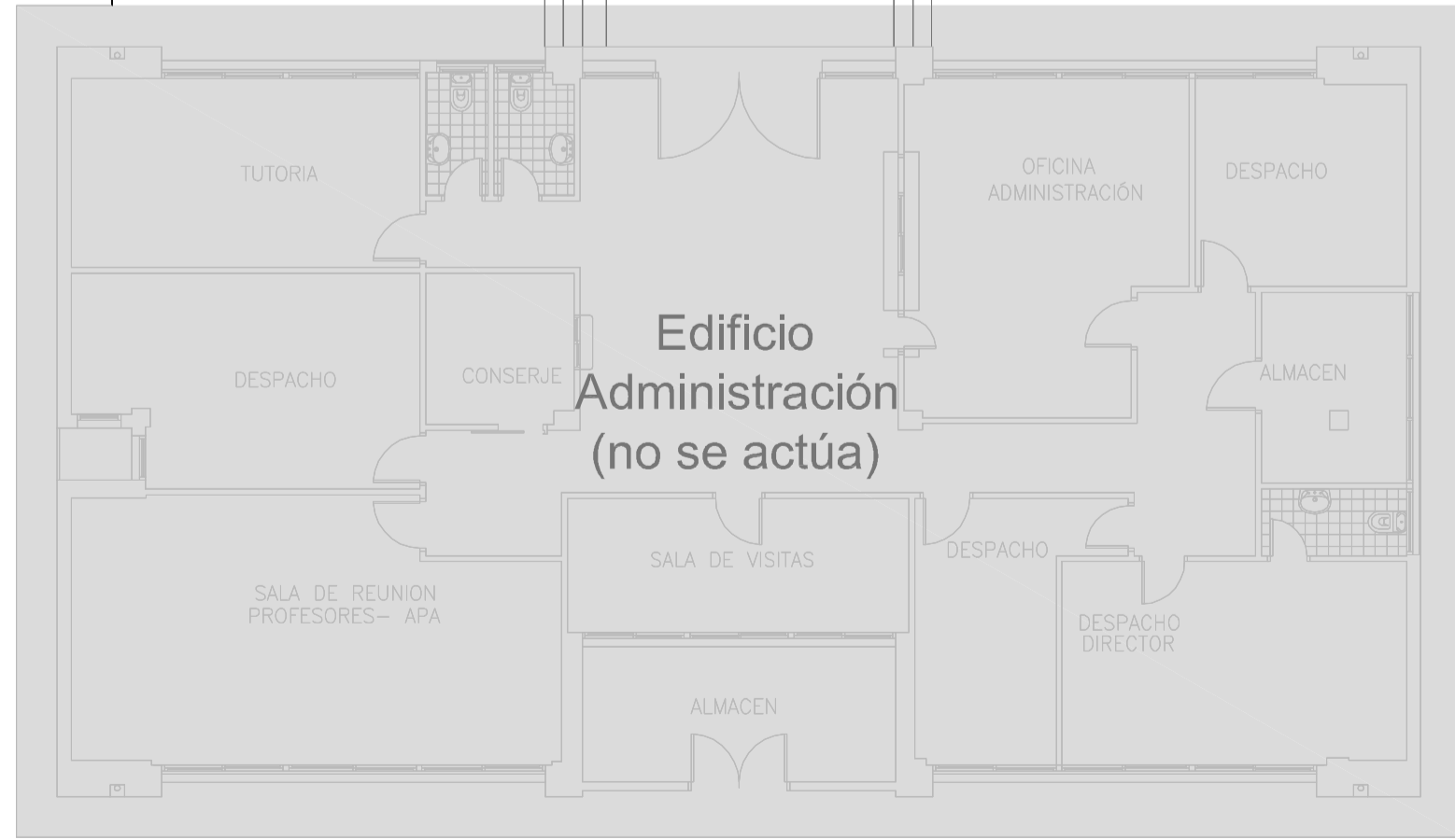
Edificio Primaria y administración