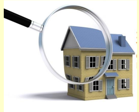
Inspección del estado del edificio.