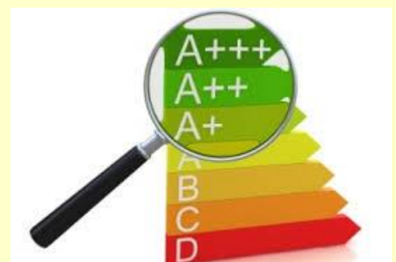
Calificación energética del edificio